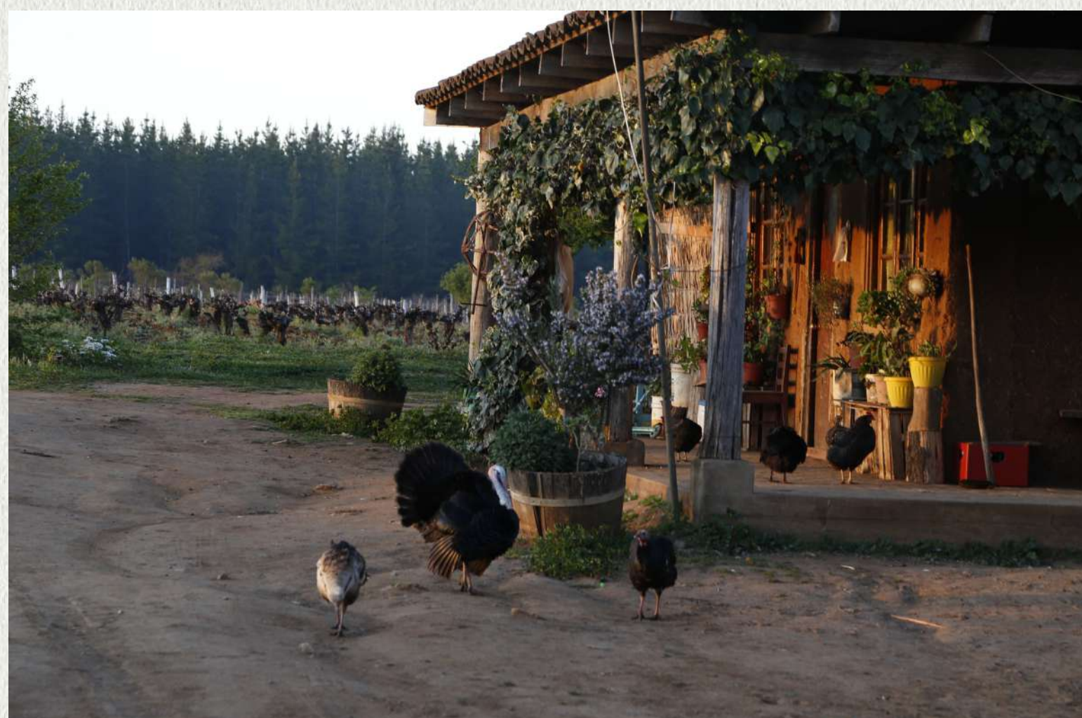
Fundo Tres Esquinas, Cauquenes.

ODFJELL CABERNET SAUVIGNON 2015 Cauquenes, Maule