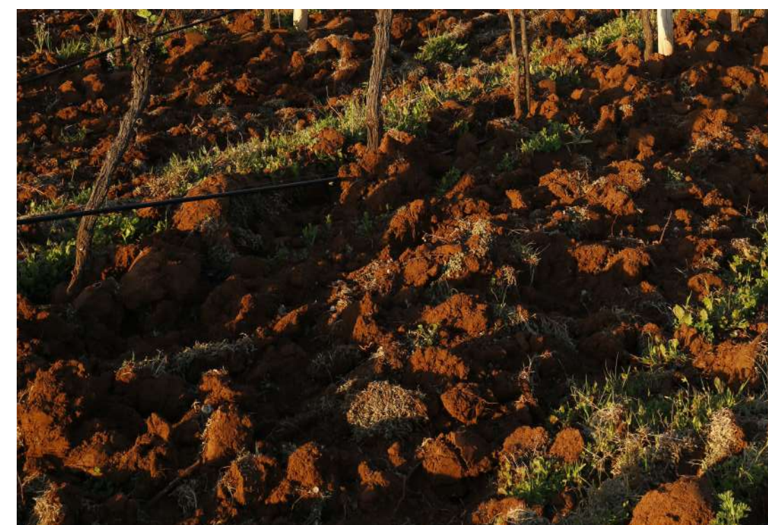
Tres Esquinas posee un suelo rojo franco arcilloso.